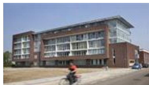
Park Viverre aan de Mierloseweg is voorzien van een digitaal Telelock slot bij de toegangsdeur.

Omdat zorgorganisaties Savant en de Zorgboog hiervan dagelijks de gemakken en ongemakken ervaren, dachten zij mee over een nieuw toegangssysteem.